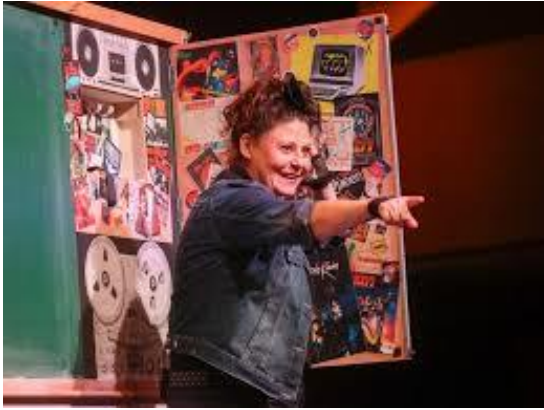
Sliki s spleta