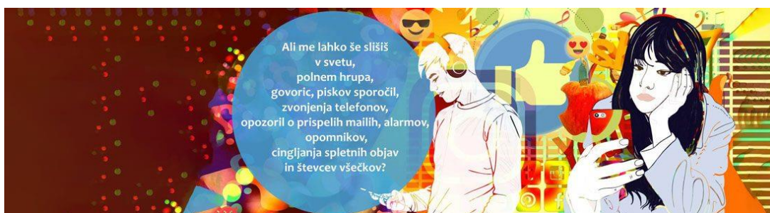
Slika s spleta