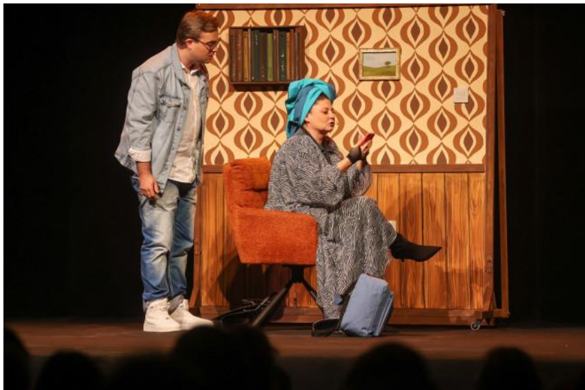
Slika s spleta

V gledališki igri sta nastopala le dva igralca. Moški je igral najstnika Aleša in Mateja, učiteljičinega sošolca iz osnovne šole, ženska pa učiteljico in mamo. Igra je govorila o spletnem nasilju. Aleš je bil učenec, ki so ga ves čas zafrkavali, ker ni imel telefona in dragih čevljev. Nekega dne mu je mama kupila telefon. A Aleš je šel predaleč. Prišel je v učilnico, medtem ko se je učiteljica preoblačila. S svojim telefonom jo je fotografiral. Kasneje ji je grozil, da bo sliko objavil. Učiteljica ga je skušala pregovoriti, zato mu je povedala zgodbo iz svoje mladosti, ko je posegla v zasebnost svojega sošolca Mateja. Zaradi ponižanja je želel narediti samomor.