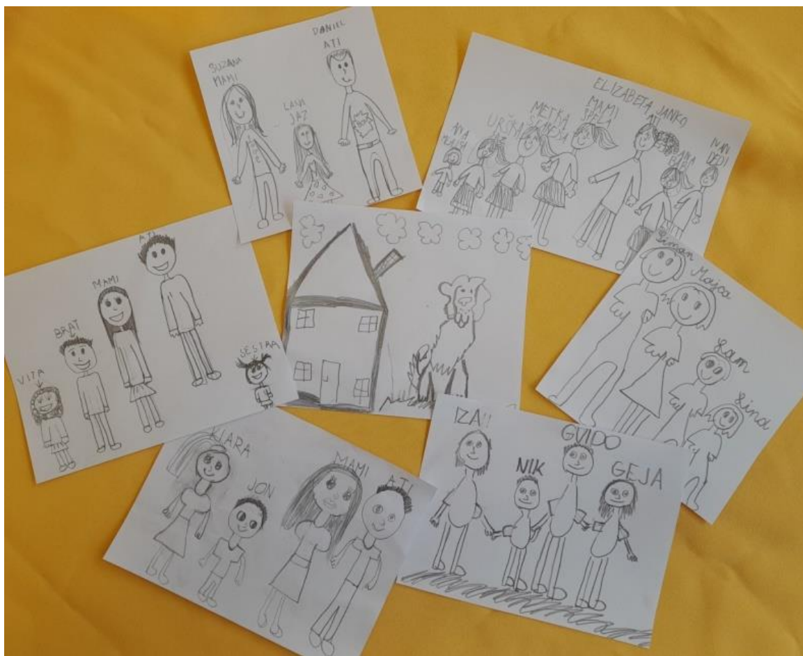
Risbice so delo učencev 2. a