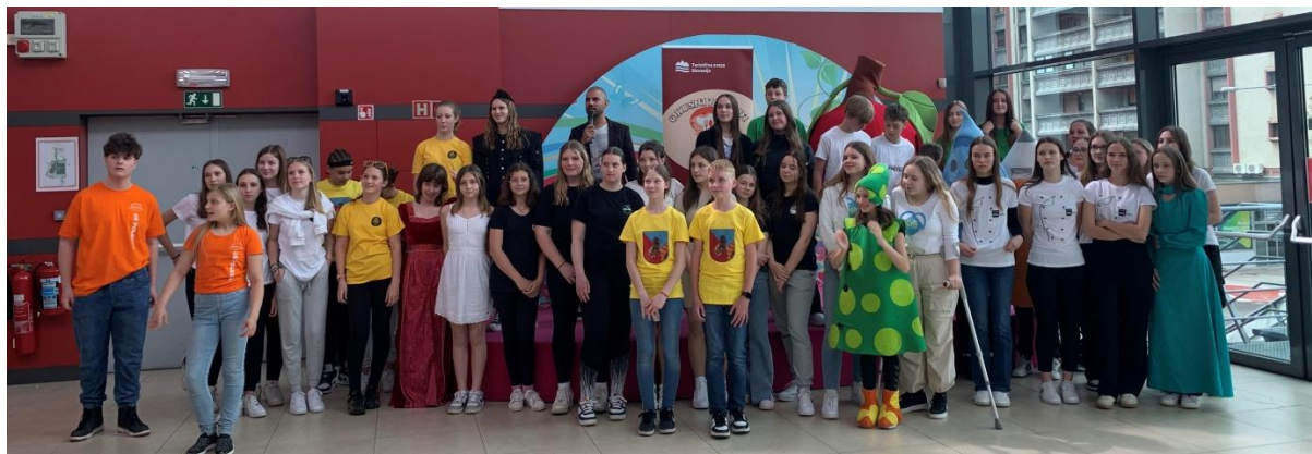
Udeleženci turistične tržnice v Velenju

S svojim turističnim izdelkom so sodelovali tudi na natečaju Turistične zveze Slovenije in se predstavili komisiji in javnosti na turistični tržnici v Mercator centru v Velenju 18. 4. 2024. Osvojili so bronasto priznanje.